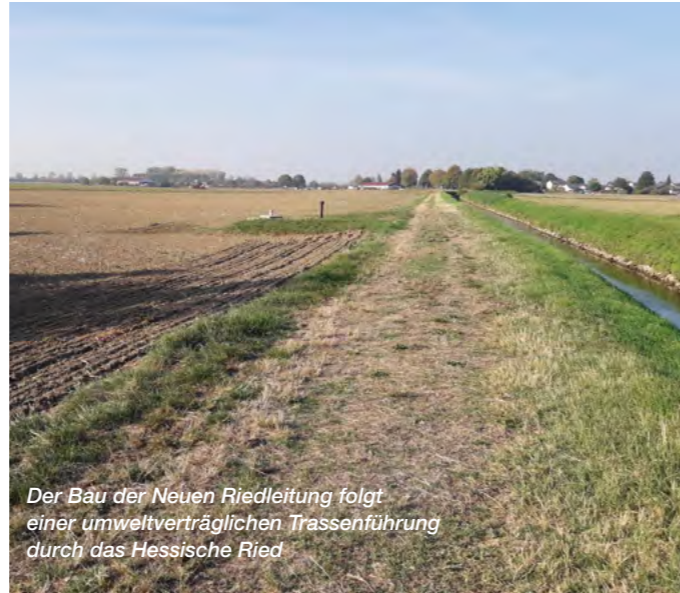
Der Bau der Neuen Riedleitung folgt einer umweltverträglichen Trassenführung durch das Hessische Ried